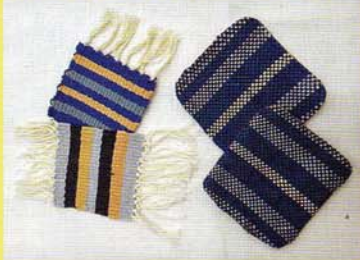
織【手織りのコースター】