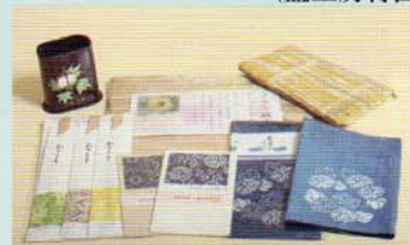
河内木綿関連商品の販売 (ええショップいろいろ アリオ八尾2階)