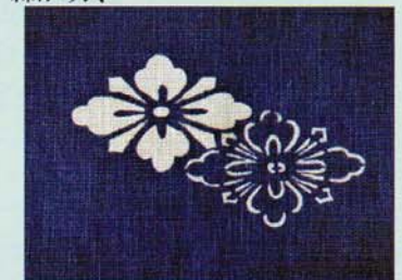
染【河内木綿文様の型彫りと藍染め】 (藍工房村西)