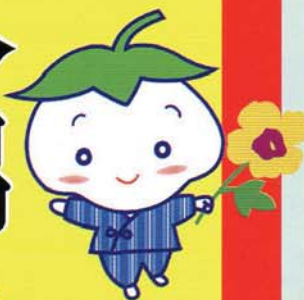
河内木綿まつり キャラクター 「わたやん」