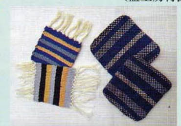
織【手織りのコースター】 (藍工房村西)