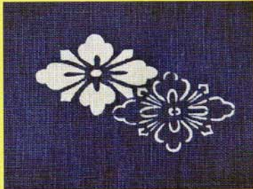
染【河内木綿文様の型彫りと藍染め】