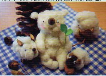
綿を使った工作体験 (八尾市立しおんじやま古墳学習館)