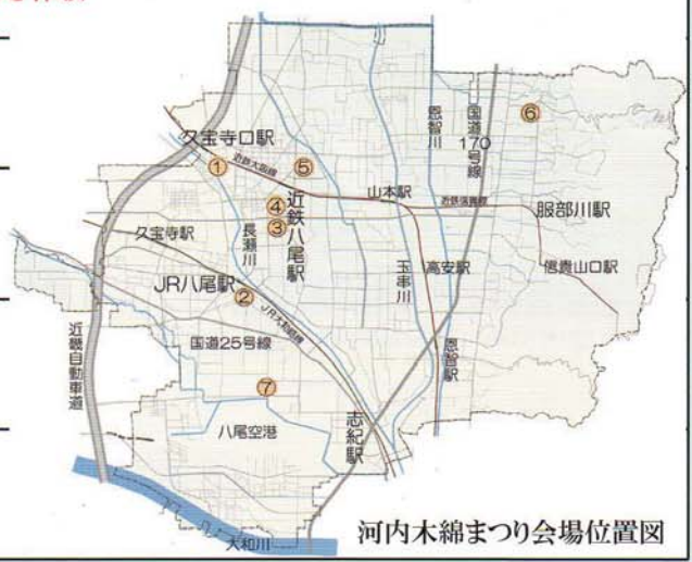
河内木綿まつり会場位置図

※9月より八尾市立歴史民俗資料館は休館中です。会場をよくお確かめの上お出掛け下さい。