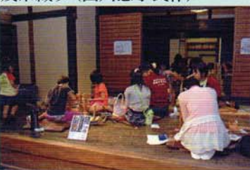
綿繰りと糸紡ぎ体験 (安中新田会所跡旧植田家住宅)